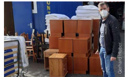
Anlieferung der Möbel durch die Caritas Graz

fonaten aber auch in einem Artikel in Večernji list, einer der größten kroatischen Zeitungen, dokumentiert.