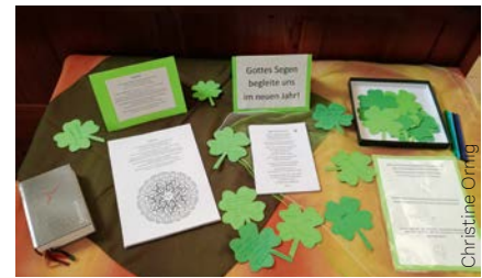
Mit Gottes Segen ins neue Jahr; Kleeblätter laden ein, Wünsche und Bitten zu formulieren.