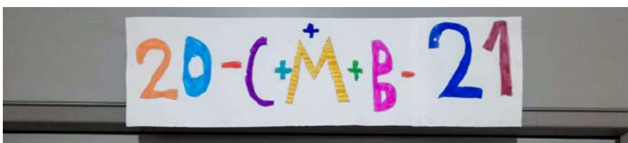
Ein Drittklässler gestaltet den Segensspruch der Sternsinger für Zuhause.