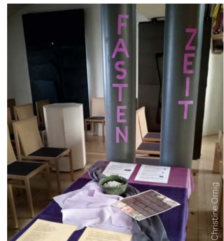
Aschermittwoch – Beginn der Fastenzeit; Asche erinnert an Vergänglichkeit, aber auch an die Chance zu Veränderung und Neubeginn.