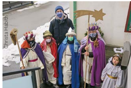
Von Haus zu Haus in Bierbaum