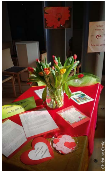
Hl. Valentin - „Bote der Liebe“; nach seinem Vorbild verschenkten wir bei der Wort-Gottes-Feier am 14.2., dem Valentinstag, bunte Tulpen und „Herzen mit lieben Worten“.