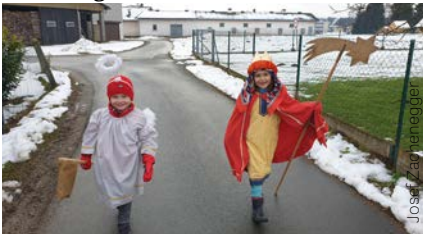
Unsere Jüngsten auf dem Weg

Eigentlich stand das diesjährige Sternsingen ja unter dem Motto „Sternsingen – mit Abstand den Segen bringen“. Denn mit vielen Auflagen, Abstandsregeln und Masken für alle über 6-Jährigen war leider so vieles anders. Doch, dass gerade im Jetzt unsere Aktion wichtiger denn je ist, durften die letztlich sieben Gruppen, die im Pfarrgebiet unterwegs waren, erleben: