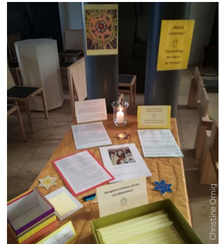
Mariä Lichtmess; Jesus ist unser „Licht der Welt“, besonders auch in dieser schwierigen Zeit! Geweihte Lichtmess-Kerzen zum Mitnehmen sollen uns auch zu Hause daran erinnern.