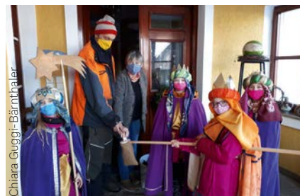
Unsere Königinnen und Könige im Einsatz für eine bessere Welt