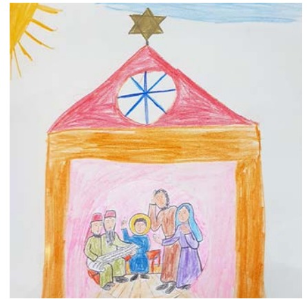
So stellt sich eine Erstklasslerin den Tempel zur Zeit Jesu vor.

Immer wieder bekam ich schöne Rückmeldungen von Kindern und El-