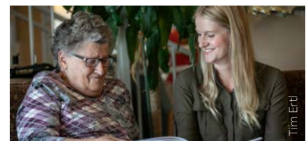
Besuchsdienst im Caritas Pflegewohnhause Lannach