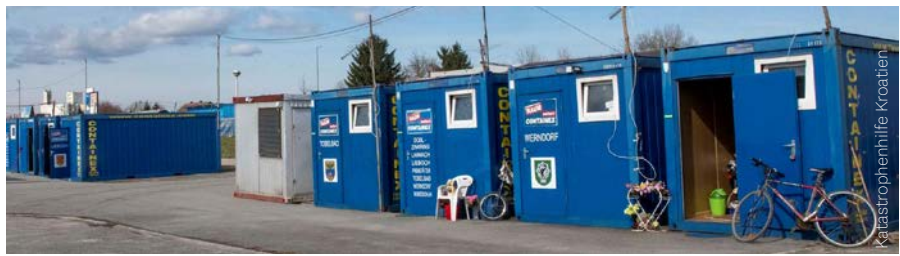
Container-Lager in Sisak