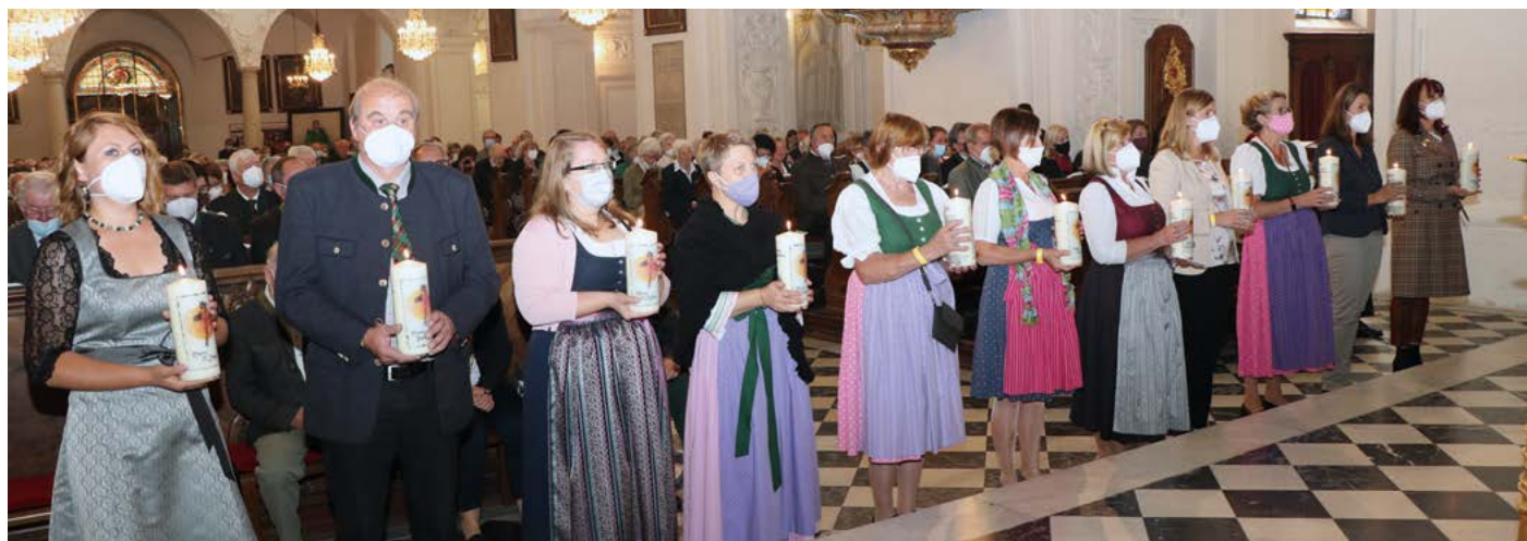
Vertreterinnen und Vertreter aus den elf Pfarren beim Startgottesdienst 2021